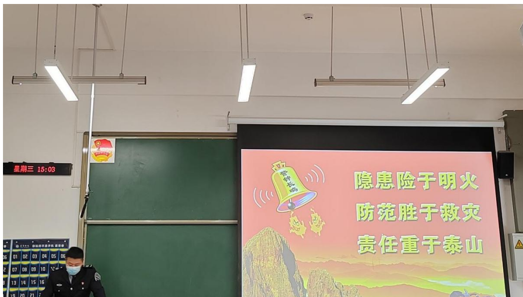
图1 警官讲解消防知识

为进一步增强消防意识、普及消防知识，提高大家对突发事件的处置能力，坚决防止火灾事故的发生，2022年11月16日下午在宜宾学院临港校区进行了实验室管理人员、实验教学任课教师、实验室分管领导等的消防培训及消防演练工作。我部实验与创新中心高度重视，组织实验室全体实验室管理人员及部分教职工参加消防培训演练。